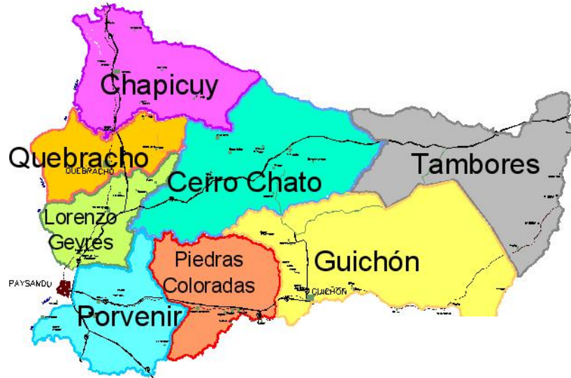
Fig.2. Mapa del Departamento, sus 8 Juntas Locales y capital

Uruguay. Otros presupuestos participativos, consejos consultivos, redes sociales en dialogo con los gobiernos locales, son algunas formas que los gobiernos progresistas de nuestro país se han dado para profundizar el dialogo ciudadano y por consiguiente la democracia.